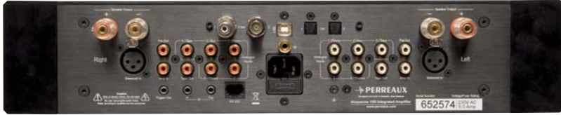
L'intégré dispose d'une connectique très complète de qualité, notamment pour ce modèle équipé des options « phono » et « DAC », caractérisées par cinq entrées numériques dont une USB.

une carte DAC. La conception quasi double-mono est appliquée à la disposition symétrique des connecteurs des 6 entrées RCA, dont l'entrée phono et une entrée (« Home ») Theatre bypassant le contrôle de volume, de l'entrée XLR et des sorties RCA « tape out » et « pré out » de part et d'autre de la fiche secteur IEC avec fusible. On note également 3 jacks 3,5 mm dédiés au trigger (allumage à distance), à l'entrée infrarouge (le 150i peut recevoir un récepteur infrarouge externe) et sortie infrarouge (le 150i peut renvoyer ses commandes), ainsi qu'un port RS232 via une RJ45 (chargement des mises à jour software et pilotage du 150i par un ordinateur). Une petite trappe amovible, au-dessus de la fiche IEC, a été retirée pour donner accès aux entrées numériques de la carte DAC, soit deux BNC, deux optiques TosLink et une USB utilisable en entrée et sortie. La carte « phono » est programmable par le menu au niveau de son gain, soit 40 dB pour les cellules MM et 60 dB pour les cellules MC. La prise de masse à raccorder au cor-